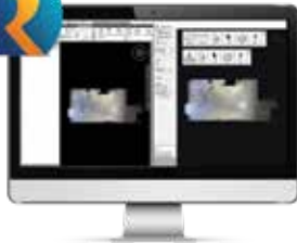
ClearEdge3D Rithm for Navisworks®