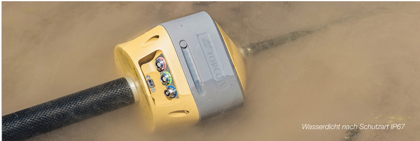
Wasserdicht nach Schutzart IP67